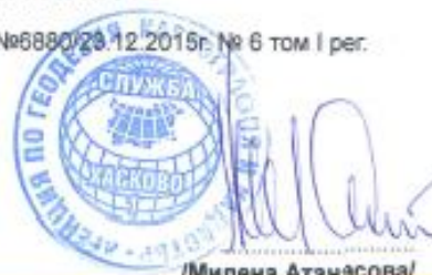
Схема № 15-987136-22.10.2020 г. издадена въз основа на заявление с входящ № 01-485111-20.10.2020 г.